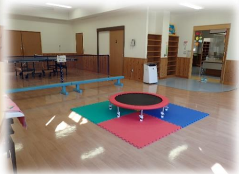
ミニトランポリンや卓球であそべます