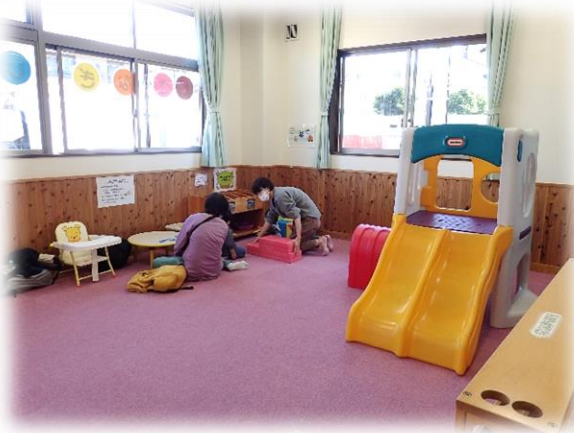
乳幼児さん専用のお部屋があります