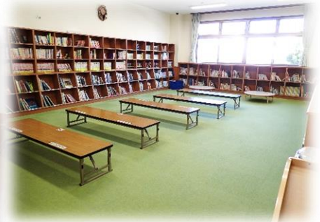
親子で絵本をゆったり読めます

※複合施設のため、駐車場は数に限りがございます。公共交通機関の利用にご協力お願い致します。