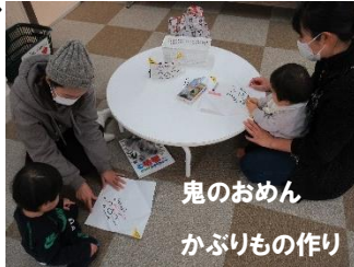
鬼のおめん かぶりもの作り