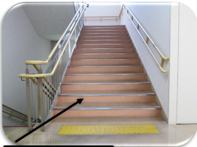
階段の蹴上げと踏面

蹴上げ（高さ）は 16cm、踏面（幅）は 32.5cm あります。これは児童にも対応した高さ（建築基本法施行令）になっています。昇り降りの負担を減らし、すべての人が利用しやすい階段になっています。