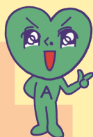
葵区PRキャラクター あおいくん