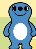
清水区広報キャラクター シズラ