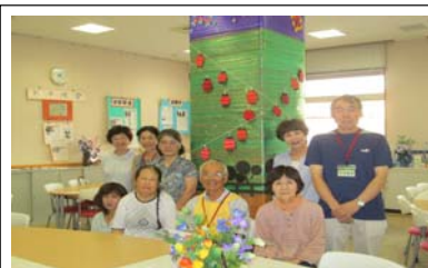
8 月 定 例 会