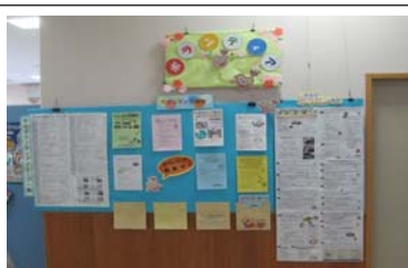
エリボラさん作成掲示物