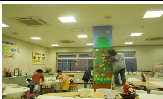
掲 示 物 作 成 作 業