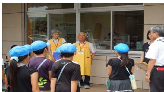
エ リ ア 見 学

A. 葵区城東町にある保健福祉エリアの各施設で、いろいろなお手伝いをしてくれるボランティアさんです！