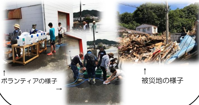
↑ ボランティアの様子