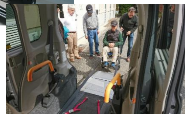
定例会での介助講座の様子

無理せず、自分のペースで進めることです。そのほか、同じ志を持つ人たちと一緒に活動することも、良い刺激になります。