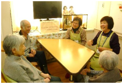
みんなでワイワイ話すこともあります

2月に開催される『市民交流まつり in はーとぴあ清水』に参加します！展示ブースでは日頃の活動紹介をしますので、ぜひ見に来てください！そして、傾聴に少しでも興味を持ってもらえたらと思います♪