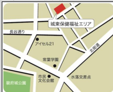
葵区地域福祉推進センター

静岡市葵区城東町24-1 静岡市地域福祉交流プラザ内 TEL. 054-249-3183