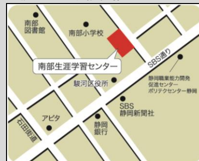
駿河区地域福祉推進センター

静岡市駿河区南八幡町25-21 静岡市南部生涯学習センター内 TEL. 054-280-6150