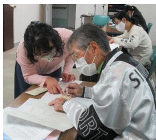
アイボランティア入門講座で 受講生に教えている様子