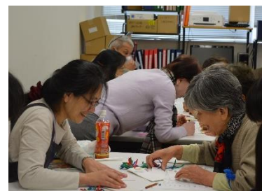
市民交流まつり点字体験の様子

点字に興味を持ち始めたのは、小学4年生の時に兄の高校の文化祭で点字のしおりをもらったことがきっかけです。その後静岡市の広報誌「静岡気分」を見て「アイボランティア入門講座」を受講し、その時に点字の講師をしていた「あかつき」を知り講座終了後に入会しました。