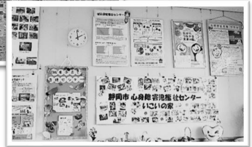
▲特徴を上手にまとめて展示しています。