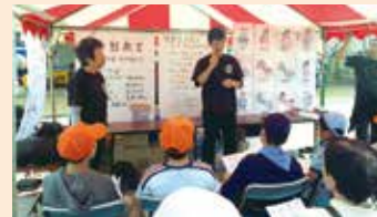
手話サークルたつのご会による手話教室

※9月8日(日)に開催を予定していましたが「第40回静岡ふれあい広場」は天候不良により中止となりました。