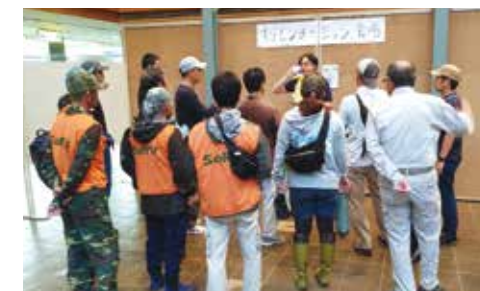
活動出発前のオリエンテーションの様子

損壊した屋根へのブルーシート張り、高所での作業、倒木撤去のためチェーンソーによる作業等、危険を伴うニーズが多く、専門性とスキルをもつボランティアの確保を必要とし、風水害による災害ボランティアセンター運営の難しさと本市での災害ボランティア活動の教訓となりました。