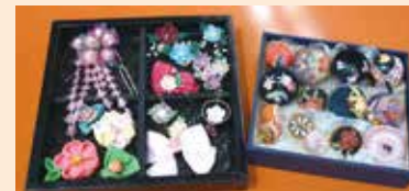
作品【つまみ細工とコマ】