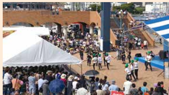
多くの観客で賑わうステージ

福祉のまつり実行委員会では、9月22日(日)に毎年恒例の「福祉のまつり 2019」を開催しました。今回は109団体が参加。福祉施設のボランティア団体による活動体験や自主製品販売のほか、ステージでは、ダンスや太鼓、吹奏楽などの多彩なプログラムが披露されました。会場となった清水マリナパークイベント広場は、エスパルスドリームプラザ隣接ということもあり、一般市民の方の来場も多く、会場は大いに賑わいを見せました。