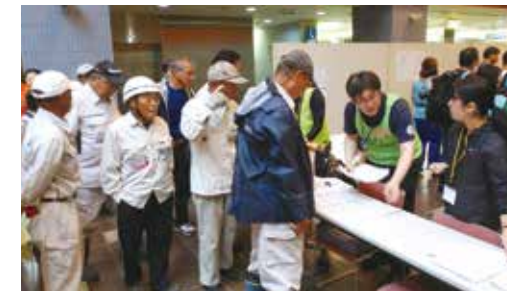
受付で登録する多くのボランティア

このたびの風水害に際し、 心よりお見舞い申し上げます。 1日も早い復旧をお祈りしています。