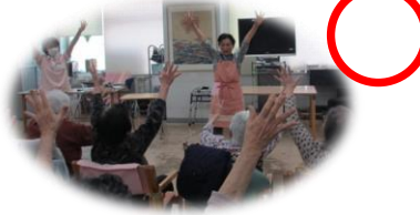
介護施設への慰問(芸披露・話し相手他)