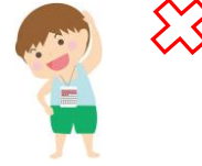
会員「のみ」のラジオ体操等